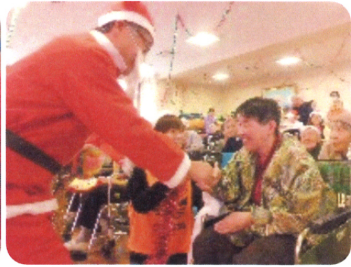
サンタさんのお別れの握手 今年も沢山楽しみました。