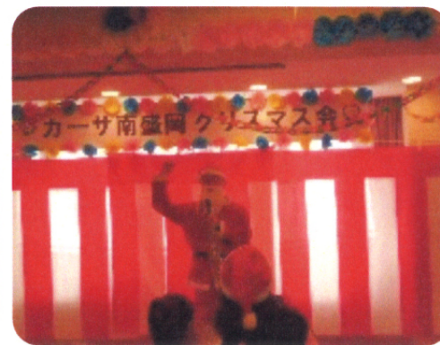
サンタさんとのジャンケン大会 サンタさんに勝てるかな?