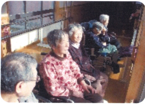
みんな一緒に日向ぼっこ