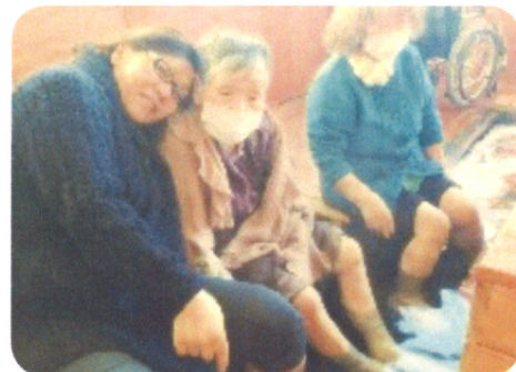
足湯にも行ってきたよ～