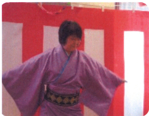
木曜会による踊りを披露