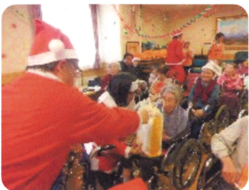
サンタさんに勝ったらプレゼント 何が貰えたかなあ?