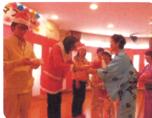
プレゼントも頂きました