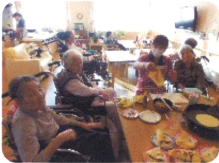
美味しくクレープ作ったよ♪