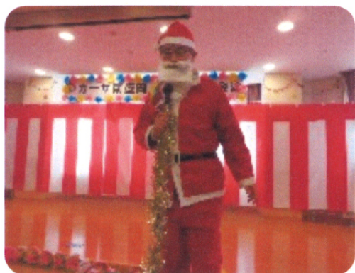
待ってたよサンタさ〜ん!!