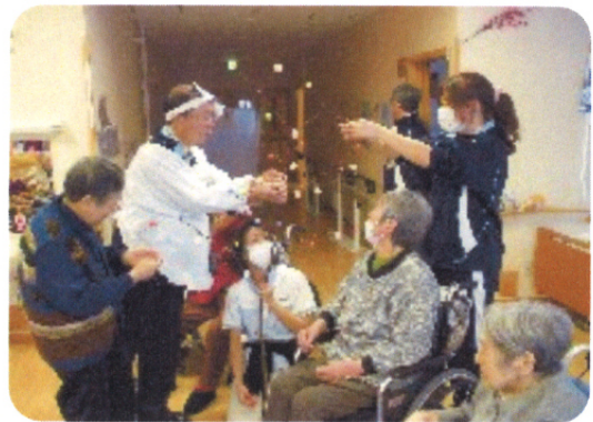
デイサービスではみずき団子作り